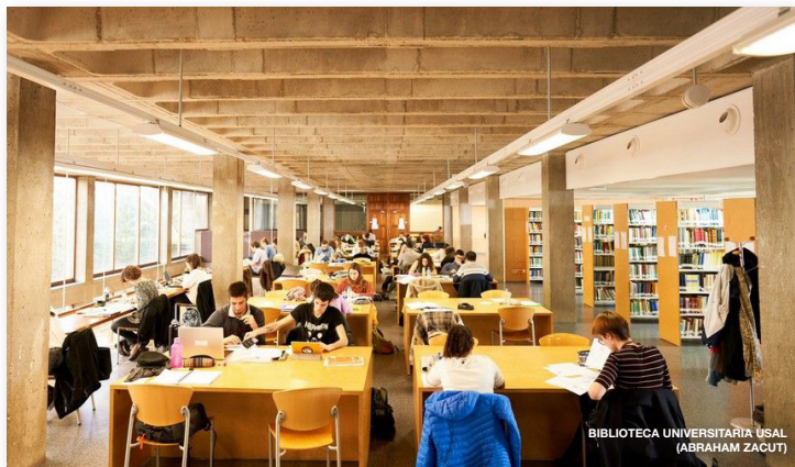
BIBLIOTECA UNIVERSITARIA USAL (ABRAHAM ZACUT)